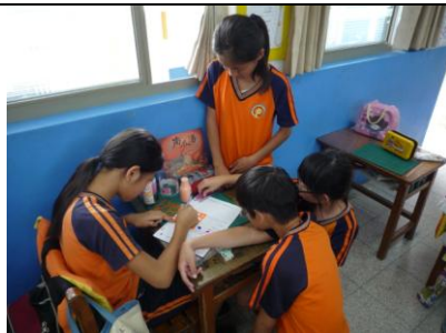
學生認真製作活動單