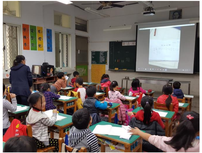
圖三、圖四：結合教學 app 與投影機進行實物投影