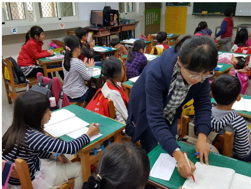
圖五：以學生所出的題目進行紙筆測驗並立即批改，瞭解學習情形