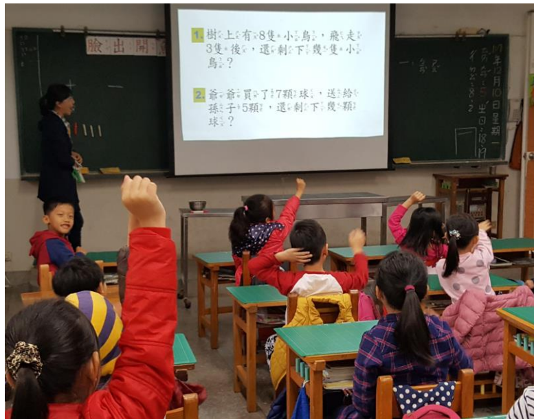
圖一：統整加法與減法概念